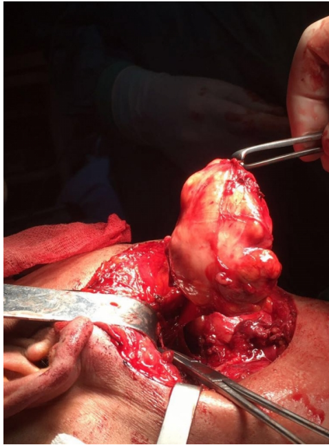
Şekil 1 : Cerrahi sırasında çıkarılan kitle

42 yaşındaki erkek hasta yaklaşık 6 ay önce başlayan ve zamanla büyüyen ağız içerisinde üst damakta şişlik ve son zamanlarda yutkunurken boğazda takılma hissi şikayeti ile hastanemize başvurdu. Peritonsiller apse ön tanısı ile medikal tedavi verildiği; fakat bu tedavilerden herhangi bir fayda görmediği öğrenildi. Ağrılı yutma, kilo kaybı, ağızını açamama gibi şikayetlerinin olmadığı anamnezinde öğrenildi. Özgeçmişinde 25 yıldır günde 1 paket sigara içimi olan hastanın herhangi bir sistemik hastalığı yoktu. Fizik muayenesinde yumuşak damakta sağ taraf ağırlıklı olmak üzere bombeleşme görüldü. Hastanın yüzünde herhangi bir asimetri yoktu, boyun muayenesinde palpabl kitle saptanmadı. Panendoskopik muayene yumuşak damaktaki bombelik dışında doğaldı. Boyun USG görüntülemesi normal olarak raporlandı. Boyun MRI görüntülemesinde orofarenks düzleminde parafarengeal alanda düzgün sınırlı yaklaşık 6x5x3,5 cm (KK-TR-AP) boyutlarında T1A sekanslarda heterojen hipointens, T2A sekanslarda heterojen hiperintens yer yer daha belirgin hiperintens kistik nekrotik komponentleri bulunan intravenöz kontrast madde enjeksiyonu sonrasında heterojen paternde yoğun kontrastlanan düzgün sınırlı kitle lezyonu raporlandı (Şekil 1).