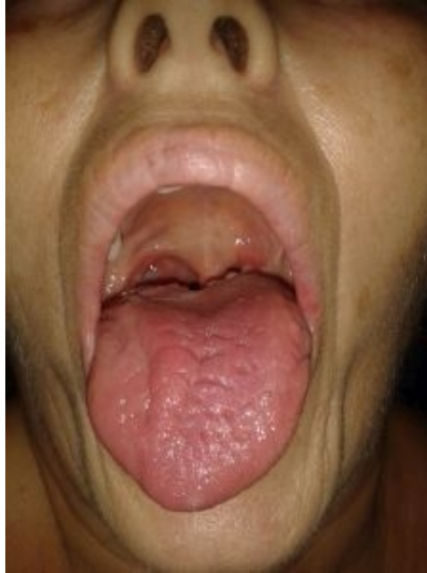
Şekil 1 : Dil sağa hareket edemiyor ve dilin sağ yarısında atrofi başlamış.

64 yaşındaki kadın hasta, ani başlayan dilde uyuşma hissi, dilini sağa hareket ettirememesi, konuşurken ve yemek yerken zorlanma yakınmaları ile polikliniğimize başvurdu. Hikayesinde son 1-2 aydır ara ara kısa süreli dilde uyuşma ve son 1 yıldır boynunun arka tarafından başlayıp başının her iki tarafına yayılan baş ağrıları vardı. Sigara ve alkol kullanım öyküsü olmayan hastanın öz geçmişinde, 9 yaşında sol bacağından osteomyelit ameliyatı, 15 yıl önce düşmeye bağlı boyun ve belinde kayma ve 13 yıl önce bir baş dönmesi atağı hikayesi vardı. Yapılan KBB muayenesinde dilini sağa hareket ettiremediği, dilde fasikülasyon, konuşmada bozukluk olduğu saptandı. Dil hareketlerindeki kısıtlamadan dolayı çiğnemede zorluklar, zaman zaman yemek yerken öksürük ve yutma zorluğu vardı. İlerleyen günlerde sağ dilde atrofik görünüm de gözlemlendi (Şekil 1).