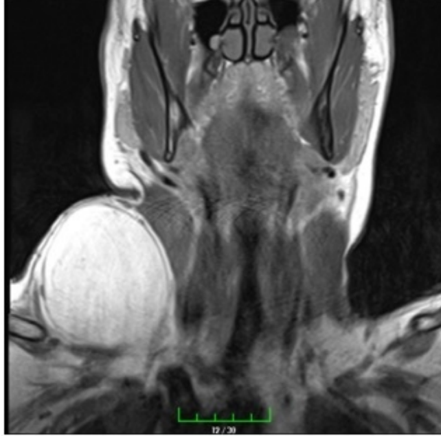
Şekil 1 : Kitlenin preoperatif MRI görüntüleri (Koronal)

Hastanın kontrastlı MRI raporunda “Boyun sağ yarımında supraklaviküler bölgede, en geniş yerinde yaklaşık 110x67x70 mm boyutlara ulaşan, T1 ve T2 hiperintens, yağ baskılı incelemede belirgin baskılanma gösteren, geniş boyutlarda lezyon dikkati çekmiştir (lipom?). Post kontrastlı incelemede tanımlanan lezyonda belirgin kontrastlanma izlenmemiştir.” şeklinde raporlanmıştır.