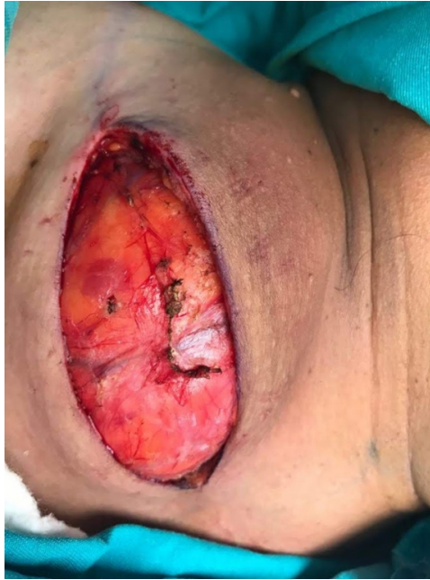
Şekil 3 : Hastanın intraoperatif kitlesinin görünümü (Sağ supraklaviküler bölge)

ve subklavian arter ve vene bası yaptığı gözlemlendi. Dikkatli diseksiyon ile komplikasyonsuz işleme son verildi.