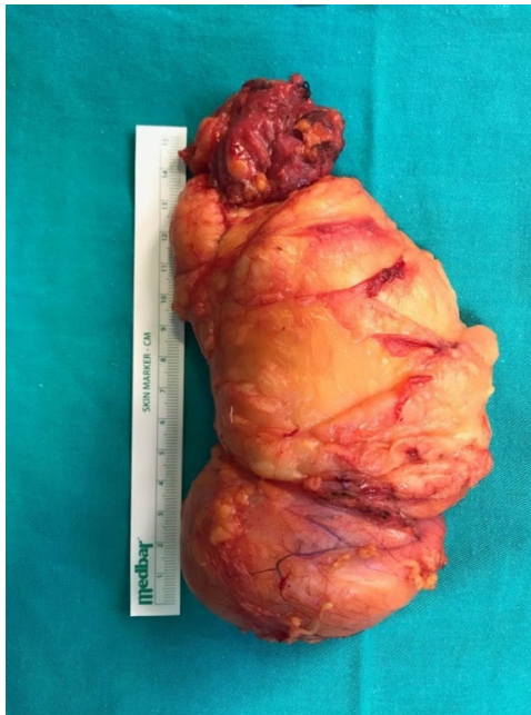
Şekil 4 : Kitlenin eksize edilmiş görünümü

İncelenen Patoloji Spesmeni 13x8x4,5cm ölçülerinde sarı-kahverengi etrafı çoğu alanda kapsüle yağ bağ dokudan oluşan materyaldir. Kesiti homojen sarı renkli olup yer yer damar yapıları içermektedir. Ayrıca kutu içerisinde 5,5x4x2cm ölçülerinde gri-kahverengi fibroadipöz doku izlenmiştir. İntramüsküler Lipom olarak patoloji