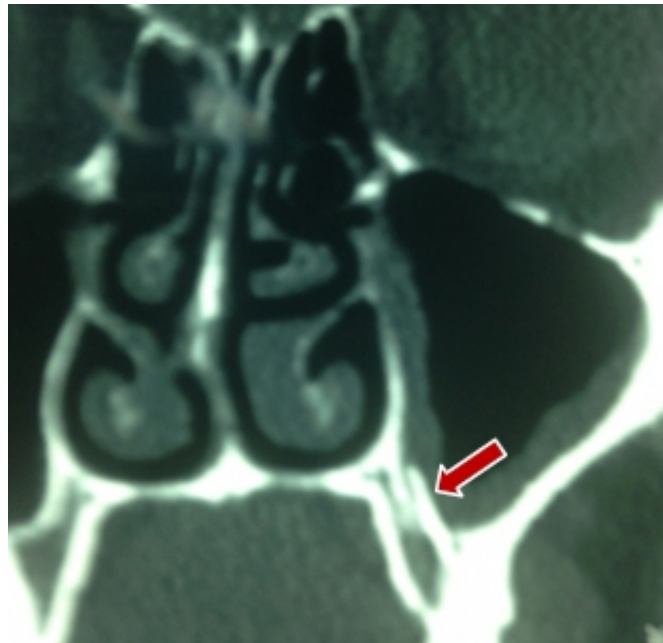
Şekil 2 : Bilgisayarlı tomografide maksilla tabanında metal iğne görüntüsü

3 ay önce hasta diş hekimi tarafından polikliniğimize yönlendirilmiştir. Bilgisayarlı tomografi (BT) istenmiş ve maksilla tabanında, tabana dikey duran ve kemik içine vertikal saplanan metal iğne görüntüsü tespit edilmiştir (Şekil 2).