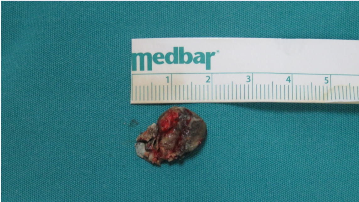
Şekil 3 :Patoloji spesmeni

Rinolitin tespitinin ardından genel anestezi altında endoskopik septoplasti ve rinolit eksizyonu yapıldı. Rinolit boyutunun 2x2 cm olduğu gözlemlendi (Şekil 3).