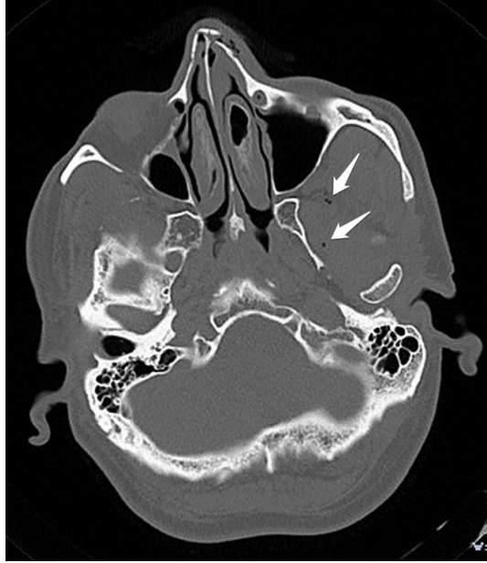
Şekil 1 : Aksiyel plan maksillofasiyal BT görüntüsü: Nazal fraktür ve infratemporal fossada serbest hava