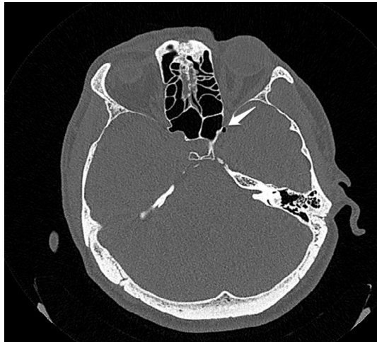
Şekil 4 : Aksiyel plan maksillofasiyal BT görüntüsü: Sfenoid sinüs lateral duvarında, optik sinir komşuluğunda intrakranial serbest hava

Hastaya nazal fraktür redüksiyonu önerildi ve ek öneriler açısından değerlendirilmek üzere beyin cerrahisine yönlendirildi. Hastanın takiplerinde BOS rinoresi saptanmadı.