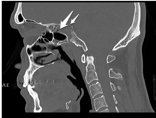
Şekil 2 : Sagittal plan maksillofasiyal BT görüntüsü: Sfenoid sinüs lateral duvarında fraktür ve komşuluğunda intrakranial serbest hava