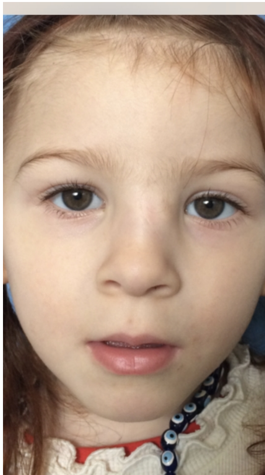
Şekil 4 : Postoperatif 1 Yıl Sonraki Görüntüsü