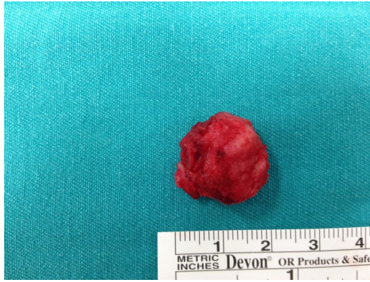
Şekil 4 : Kitlenin makroskopik görüntüsü

Hastaya genel anestezi altında nazal dorsumdan kitle eksizyonu yapıldı. Kitlenin medial sınırından “C” şeklinde insizyon ile girildi. Yaklaşık 2 cm çapındaki kitle etraf dokulardan diseke edilerek tek parça halinde rezeke edildi (Şekil 3,4). Oluşan defekt uyluktan alınan yağ grefti ile onarıldı. Hasta postop herhangi bir komplikasyon gözlenmedi ve 2. günde taburcu edildi. Histopatolojik çalışma sonucu glioma olarak raporlandı. Operasyon sahasının bir yıl sonraki görüntüsü kozmetik açıdan tatmin edici düzeydedir (Şekil 5).