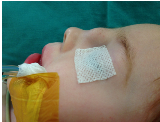
Şekil 1 : Kitlenin Preoperatif Görüntüsü

2 yaşında kız hasta, doğuştan bu yana burun sırtında gittikçe büyüyen şişlik nedeni ile ailesi tarafından kliniğimize başvurdu. Şişlik bölgesinde akıntı, ağrı, kızarıklık gibi şikayetleri olmamış. Ailede benzer hastalık öyküsü olmayan hastanın bilinen bir sistemik hastalığı da yoktu. Fizik muayenede, nazal dorsum cildinde orta hattın hafif solunda yerleşik yaklaşık 2x2 cm'lik üzeri hafif morumsu normal cilt ile kaplı, fluktuasyon ve pulsasyon vermeyen, palpasyonla ağrısız, yarı sert ve mobil kitle mevcuttu (Şekil 1).