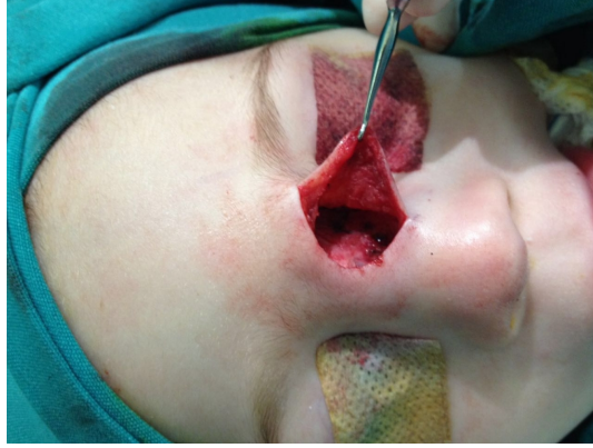
Şekil 3 : İntraoperatif Görüntü