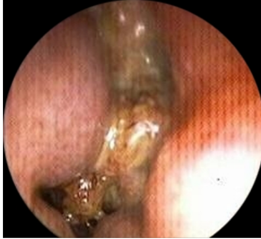
Şekil 1 : Sağ nazal kavitede orta konka konka kaynaklı kitle görünümü

olarak alt konkanın ve maksiller sinüs mediyal duvarının olmadığı görüldü. Ayrıca opere edilen sol nazal kavitede rekürrensi düşündürülecek bulguya rastlanılmadı. Sağ nazal kavitenin 0 derece endoskop ile muayenesinde sağ orta konkadan kaynaklanarak nazal kaviteyi dolduran ve düzensiz sınırları olan kitle lezyonu görüldü (Şekil 1).