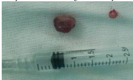
Şekil 2 :Eksizyon sonrası kitlelerin görünümü