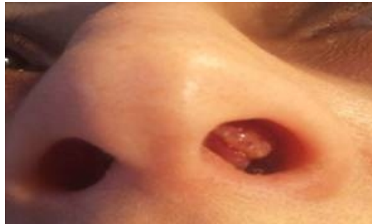
Şekil 1 :Sol little bölgesindeki lezyon

Lokal anestezi altında her iki lezyon da mukoperikondriumu da içerecek şekilde cerrahi sınırlarla birlikte total eksize edildi (Resim 2). Cerrahi alan sekonder iyileşmeye bırakıldı. Kitlelerin patolojisi pyojenik granülom olarak raporlandı. Sonrasında hastanın şikayetleri hızlı şekilde iyileşme gösterdi ve 1. yıl takiplerine kadar başka bir şikayeti olmadı.