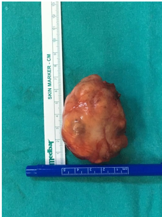
Şekil 2B : Cerrahi sırasında çıkarılan kitle

Kitlenin prestiloid yerleşimli olduğu, parotis glandı ile ilişkisinin olmadığı görüldü. Eksize edilen kitle 7,5x5,5x5 cm olarak ölçüldü. Patoloji sonucu atipik pleomorfik adenoma ile uyumlu olarak raporlandı. Hastanın takiplerinde ilk 6 ay nüks izlenmedi.