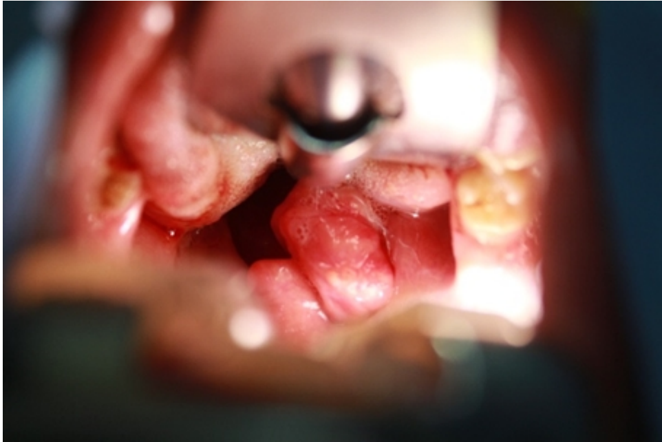
Şekil 1 : Davis-Boyle ağız açacağı ile sağ palatine tonsile yapışık düzgün sınırlı kitle

Otuzbir yaşında kadın hasta yutma güçlüğü sebebiyle kliniğimize başvurdu. 1 ay önce geçirmiş olduğu üst solunum yolu enfeksiyonu sonrasında şikayetinin başladığını belirten hastanın muayenesinde sağ palatin tonsil asimetrik hipertrofik görüldü. Hastanın yakın zamanda kilo kaybı, nefes darlığı şikayeti ve kronik hastalık öyküsü yoktu. Endoskopik muayene de nazal kavite, nasofarenks, hipofarenks ve larenks muayenesinde ek patoloji gözlenmedi. Yapılan boyun muayenesinde lenfadenopati palpe edilmedi. Kitle; tonsil dışında komşu yapılara invaze olmayıp tonsil loju ile sınırlı olduğu için ek radyolojik tetkik istenmedi. Takibinde hastaya tanı ve tedavi amacıyla sağ tonsillektomi planlandı. Genel anestezi altında trans-oral yolla sağ tonsilde asimetrik düzgün plan veren kitle sağ tonsil dokusuyla birlikte eksize edilerek patoloji bölümüne gönderildi (Şekil 1).