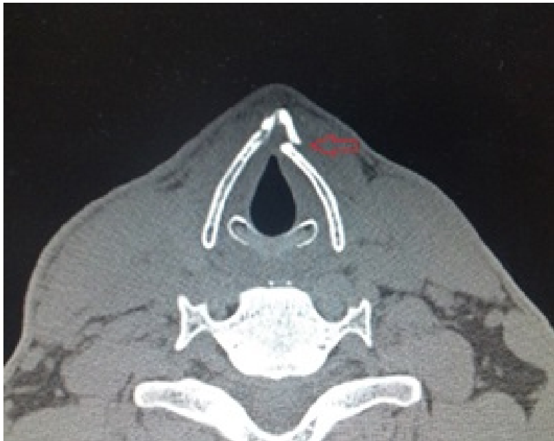
Şekil 3 : Bilgisayarlı boyun tomografi (BT) tetkikinde sol tarafta tiroid kartilaj anterior 1/3'ünde deplase fraktür hattı izlenmektedir.

Havayolu açıklığı yeterli olarak değerlendirildi. Çekilen bilgisayarlı boyun tomografi (BT) tetkikinde yalnızca sol tarafta tiroid kartilaj anterior 1/3'ünde deplase fraktür hattı izlendi (Şekil 3). Solunum sıkıntısı tariflemeyen hastada cerrahi tedavi düşünülmedi.