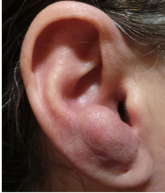
Şekil 1 : Sağ aurikula antitragus lokalizasyonunda 2x3 cm lik yüzeyi düzgün AVM

39 yaşında kadın hasta tarafımıza sağ kulakta 5 yıldır olan şişlik, sağ taraflı pulsatil tinnitus şikayetleriyle kliniğimize başvurdu. Öyküsünde kulak akıntısı, işitme kaybı, baş dönmesi, kulağa travma, aurikulada enfeksiyon, hormonal dengesizlik yoktu. Fizik muayenesinde sağ aurikula antiheliks lokalizasyonunda 2 x3 cm'lik palpasyonla üfürüm hissedilen ağrısız kitle izlendi [Şekil 1].