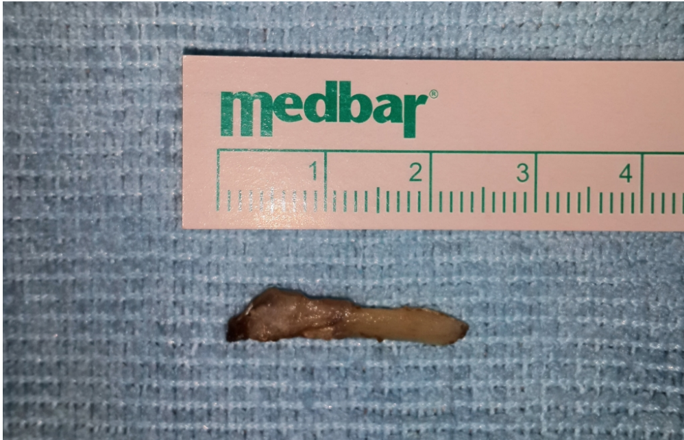
Şekil 1 : Kopan kemik fragmanı

Çekilen BT'si "Sağ mandibula lateralinde kas grupları içerisinde 2 cm uzunlukta yabancı cisim ile uyumlu yüksek dansite ve bu düzeyde ciltte defekt izlendi." şeklinde raporlandı. Volume rendering yöntemi ile elde edilen 3 boyutlu BT imajları incelendi. Şekil 1'de kopan kemik fragmanı, Şekil 2'de ise mandibulaya olan mesafesi görülmekte. Fragmanın koştığı ramus posterior sınırı ve bölgedeki düzensizlik posteriordan net bir şekilde izlenmekte (Şekil 3 - Kırmızı ok). Bölgenin posterolateralden görünüşü ve fragmanın ilginç rotasyonu, aynı zamanda mandibula üzerindeki eski konumu Şekil 4'te net bir şekilde görülmekte.