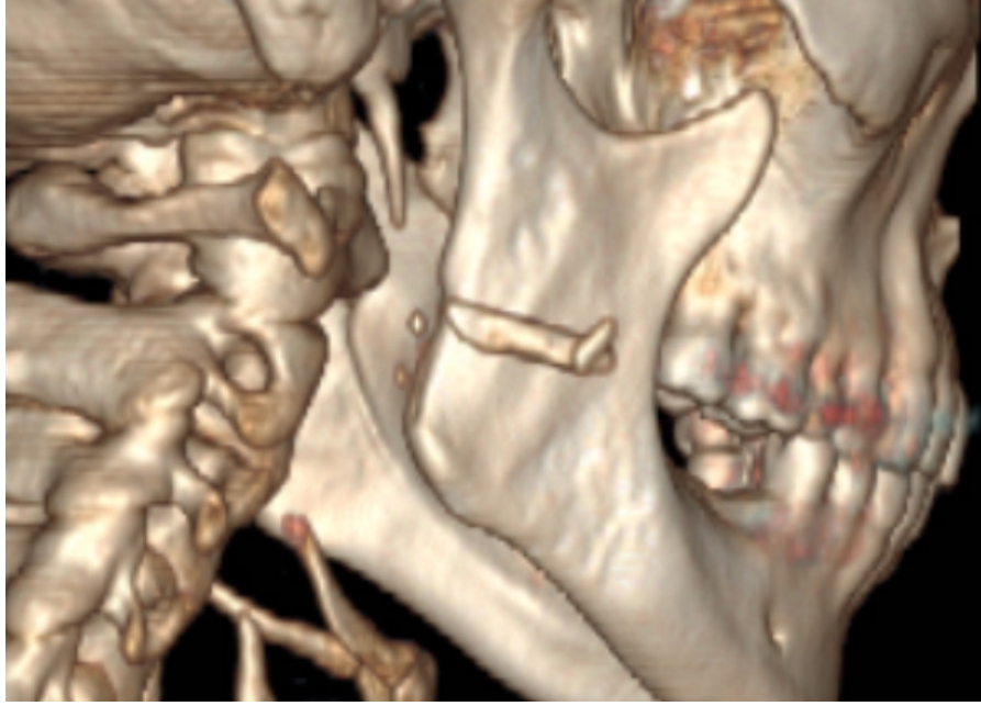
Şekil 4 : Posterolateralden görünüm

Hastaya genel anestezi altında cerrahi uygulandı. Yapılan yara eksplorasyonunda cilt altı dokulardan ayrılarak sternokleidomastoid kas içerisinden kemik fragmanı eksplore edilerek çıkarıldı. Kesi alanı cilt ve cilt altı süturleriyle kapatılarak operasyon sonlandırıldı. Hastanın takiplerinde yara iyileşmesinin iyi olduğu görüldü, minimal marjinal mandibular paralizi devam etti. Bunun dışında hastanın ek problemi olmadı.