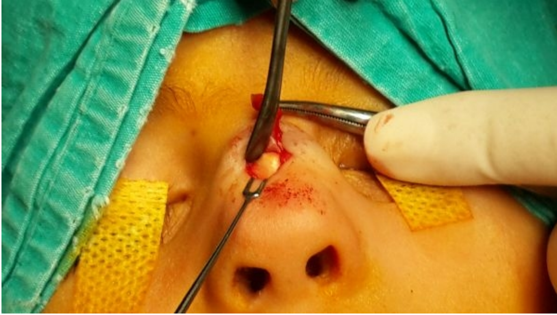
Şekil 1 : Kistin intraoperatif görünümü

Hastaya dermoid kist ön tanısı ile genel anestezi altında operasyon planlandı. Nazal dorsuma cilt pililerine paralel horizontal insizyon yapıldı, cilt altındaki kistik oluşumun üzerine düşüldü.