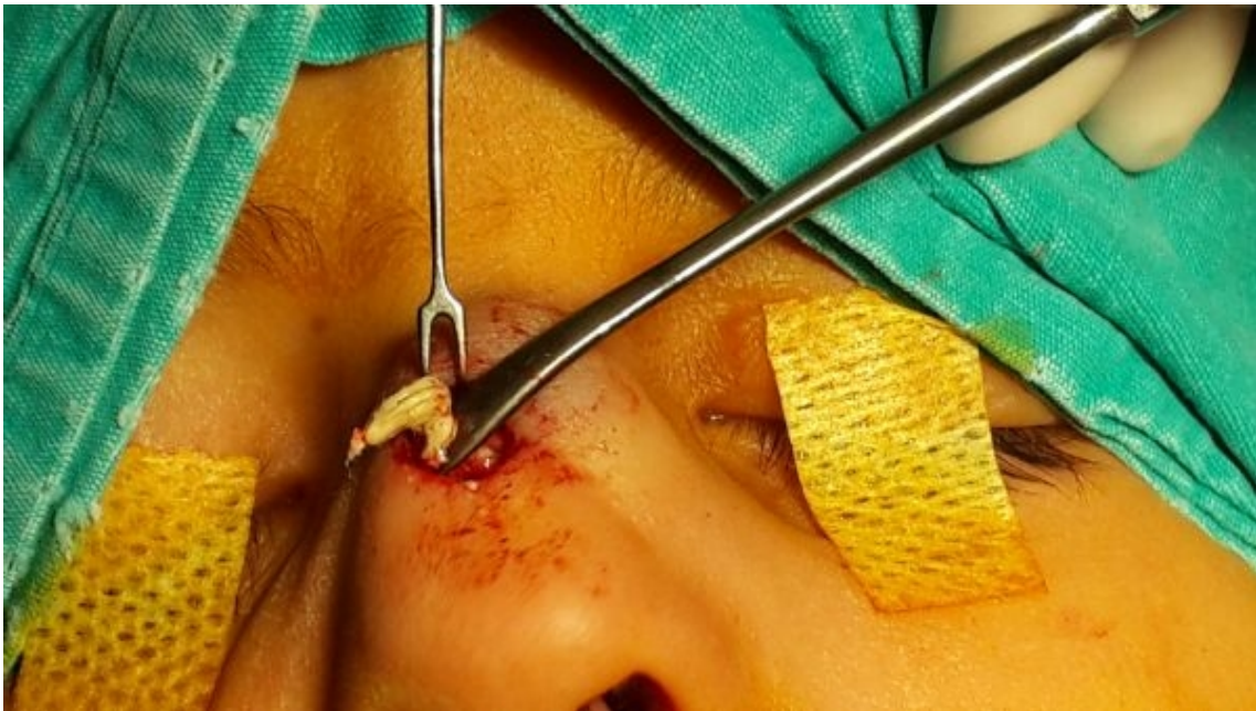
Şekil 2 : Kist cidari içerisindeki yoğun kıl birikimi

Kist cidarları çevre dokulardan disseke edilerek eksize edildi. Kist duvarı açıldığında içerisinde yoğun kıl birikimi olduğu görüldü.