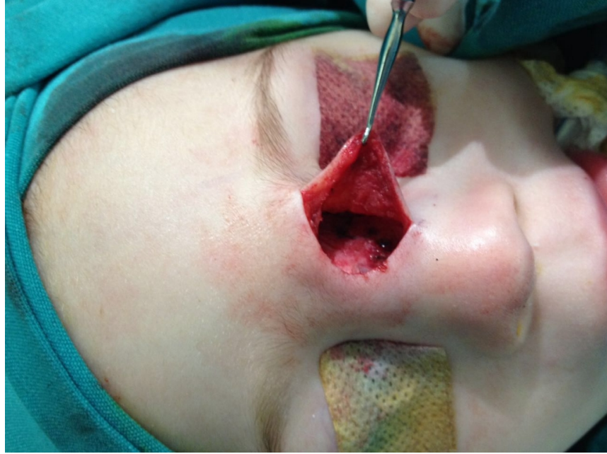
Şekil 3 : İntraoperatif Görüntü