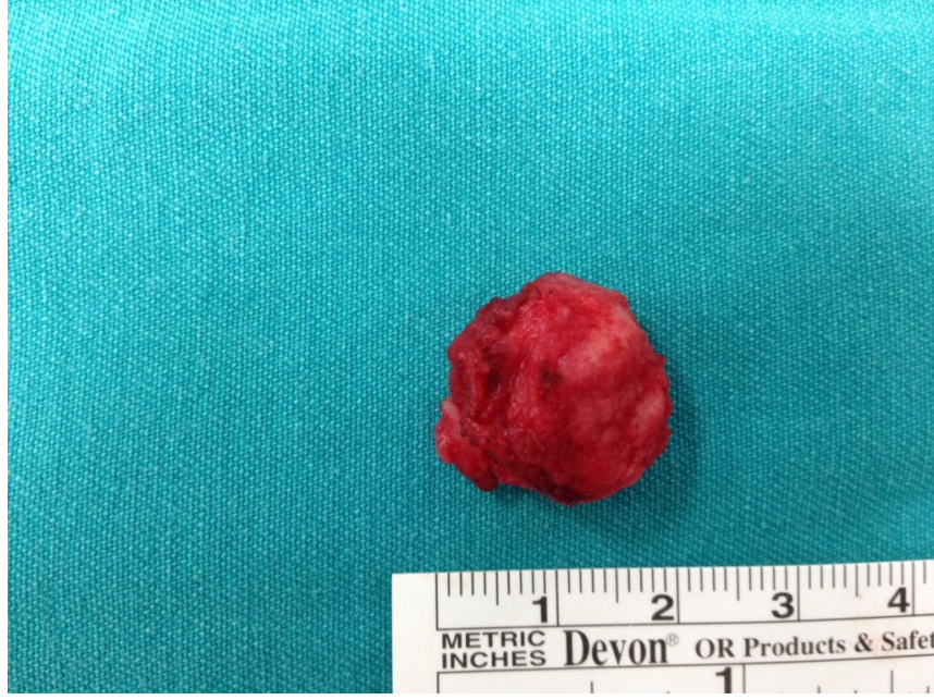
Şekil 4 : Kitlenin makroskopik görüntüsü