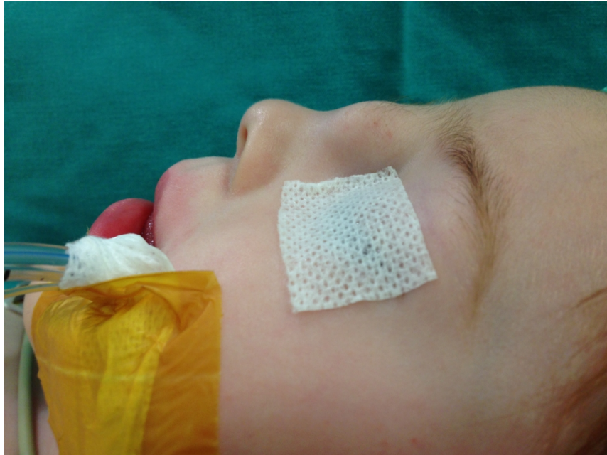
Şekil 1 : Kitlenin Preoperatif Görüntüsü

2 yaşında kız hasta, doğuştan bu yana burun sırtında gittikçe büyüyen şişlik nedeni ile ailesi tarafından kliniğimize başvurdu. Şişlik bölgesinde akıntı, ağrı, kızarıklık gibi şikayetleri olmamış. Ailede benzer hastalık öyküsü olmayan hastanın bilinen bir sistemik hastalığı da yoktu. Fizik muayenede, nazal dorsum cildinde orta hattın hafif solunda yerleşik yaklaşık 2x2 cm'lik üzeri hafif morumsu normal cilt ile kaplı, fluktuasyon ve pulsasyon vermeyen, palpasyonla ağrısız, yarı sert ve mobil kitle mevcuttu (Şekil 1).