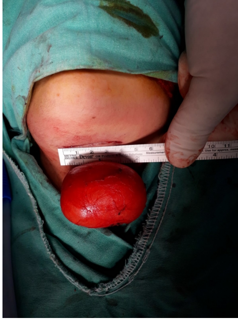
Şekil 3 : Kistin intraoperatif görüntüsü.

Yapılan makroskopik incelemede dış yüzü düzgün ince bir kapsülle çevrili 6*4*3 cm ölçüsünde, içinde seröz mayi ve 4*3*3 cm ölçülerinde sarı renkte macunumsu madde olan lezyon görüldü. Histopatolojik incelemede etrafı çok katlı yassı epitelle döşeli lezyon epidermal kist olarak raporlandı (Şekil 4, 5).