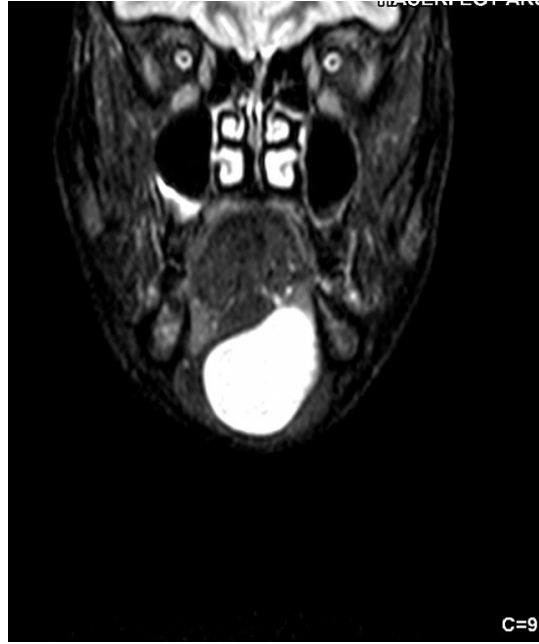
Şekil 1 : T2 serilerde MRG koronal kesit. Ağız tabanında hiperintens 55*28*52 mm kistik lezyon.