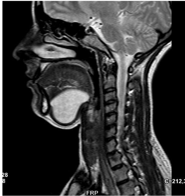
Şekil 2 : T2 serilerde MRG sagittal kesit. Kitlenin sagittal planda görüntüsü.

Submental bölgeye yapılan yaklaşık 4 cm'lik horizontal insizyonla, düzgün sınırlı kitle kapsülüne zarar vermeden eksize edildi. Kitlenin ölçülen en büyük çapı 60mm'ydi (Şekil 3).