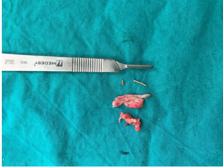
Şekil 6 : Maksiller sinüsten kürete edilen enflame dokular ve kanal dolgu materyali olan gutta perka

Sağ üst birinci molar dişin mesiobukkal kökünde kanal preperasyon eđesi gözlemlendi. Sağ üst birinci molar ve ikinci molar dişlere kök ucu rezeksiyonu yapıldı. Bölge primer olarak kapatıldı. İlgili bölgeden çıkarılan granüle doku patolojik incelemeye gönderildi. Patolojik incelemede materyalin tamamından hazırlanan seri kesitlerde yüzeysel psödostratifiye, silialı epitelle döşeli dokuların subepiteliyal stromasında fokal alanlarda yoğunlaşan mononükleer iltihabi hücre infiltrasyonu ve konjesyone damar yapıları izlendi. Hastanın rutin klinik ve radyografik kontrolleri devam etmektedir.