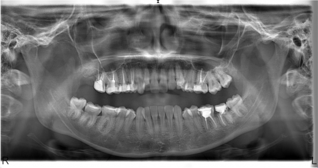
Şekil 4 : Sağ üst molar dişlerde gözlenen taşkın kanal dolumları ve sinüs içerisindeki kanal dolgu materyalleri