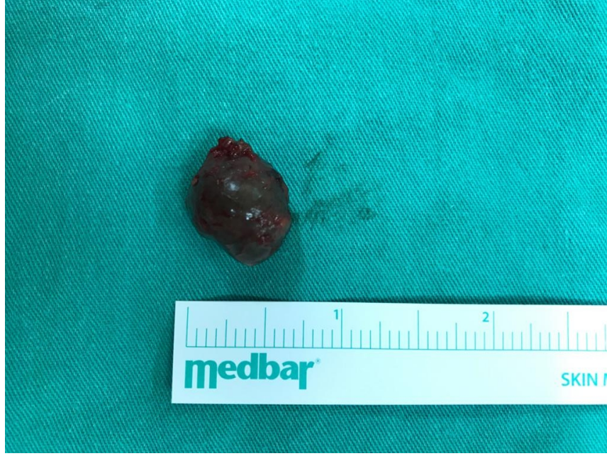
Şekil 2 : Eksize edildikten sonra kistik lezyon

Hasta bir gün hastanemizde interne edilerek takip edildi. Hastanın yapılan takiplerinde horlamada, burun tıkanıklığında ve nefes almada güçlük şikayetinde gerileme tespit edildi. Histopatolojik inceleme sonucu submukozal silyalı psödostratifiye epitelle örtülü benign kistik lezyon Thornwaldt kisti ile uyumlu olduğu görüldü. Hastanın kliniğimizdeki iki yıllık takiplerinde herhangi bir şikâyeti ya da bulgusunun olmadığı görüldü. Horlama, burundan nefes almakta güçlük, nefes darlığı şikayetlerinin tamamen ortadan kalktığı görülmüştür.