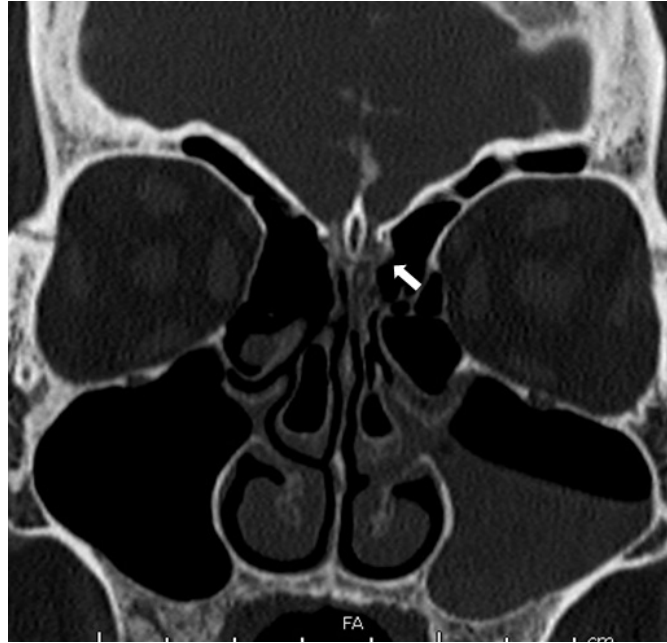
Şekil 1 : BOS kaçağını gösteren BT

Yine bir kap içine toplanan burun akıntısından, laboratuarda beta 2 transferin ve biyokimyasal analiz sonucunda gelensivinin BOS olduğu doğrulandı. Gözlerin fundus muayenesi oftalmolojist tarafından yapıldı ve normal bulundu. İleri tetkik amaçlı MRI, BT ve BT sisternografi yapıldı ve etmoid hücrelerin ön orta bölümünde 3 mm kemik defekti görüldü (Şekil 1).