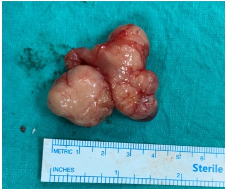
Şekil 2 : Kitlenin makroskopik görünümü

Hastanın kitlesi transservikal yaklaşımla eksize edilerek tam olarak çıkartıldı. Herhangi bir komplikasyon gözlenmedi. Postoperatif 3. günde dreni çekilerek taburcu edildi. Patolojisi pleomorfik adenom olarak rapor edildi (Şekil 2).