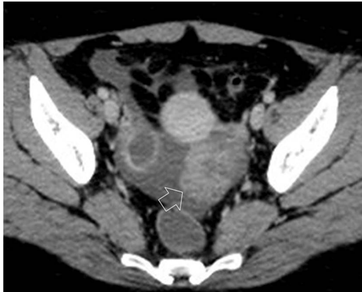
Şekil 3 : Pelvik sıvı ile çevrili, sol overde kitle (açık ok).

Özgeçmişinde belirgin bir problem saptanmayan hastamızda derin ven trombozu etyolojisinde yer alan maligniteye sekonder hiperkoagülabilité sendromu araştırıldı. Tümör markırlarından Ca 125: 146.7 (0-35) olarak saptandı. Trombozun kaynağını araştırmak için çekilen toraks ve abdomen BT'lerinde,; sol adneksiyel alanda 6 cm çapında, tüylü görünümde solid kitle izlendi (Şekil 3).