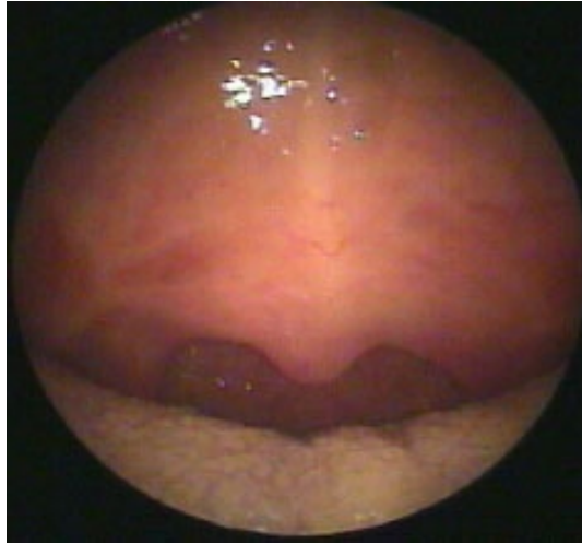
Şekil 4 : Tedavi sonrası yumuşak damak ve uvula görüntüsü

Ayrıca tedavi sonrası 14. ayında yapılan muayene ve hematolojik tetkiklerinde nüks bulgusu saptanmadı (Şekil 4).