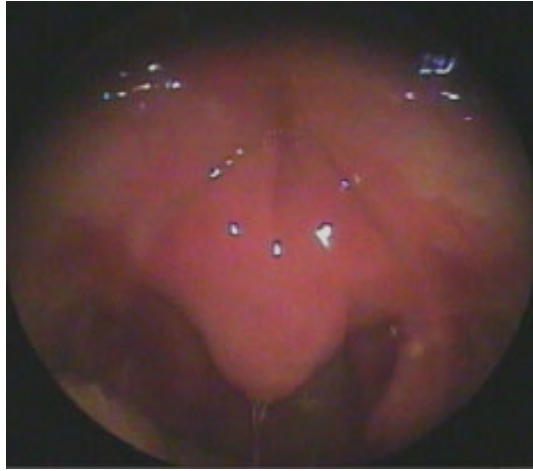
Şekil 1 : Tedavi öncesi yumuşak damak ve uvula görüntüsü

Nazal mukoza soluk, her iki nazal kavitede mukopürülan sekresyon mevcuttu. Nazal kavite aspirasyonu sonrası yapılan fleksibl fiberoptik nazofarengoskopide nazofarenks normal, yumuşak damak posterior yüzü ödemli ve hiperemikti, mukozal düzensizlik mevcuttu, larengeal yapılar normaldi. Otoskopik muayene bilateral normaldi. Paranasal sinüs bilgisayarlı tomografisinde paranasal sinüs havalanmaları normal, nazal kavitede sekresyon mevcut, yumuşak damakta ödem saptanmıştı. Hastadan alerji ve immünsüpresyon açısından değerlendirilmesi amacıyla Alerji-İmmunoloji ve Enfeksiyon Hastalıkları konsültasyonları ile yumuşak damaktaki ödem nedeniyle Maksillofasiyal bölge için manyetik rezonans görüntüleme (MRG) istendi. Alerji-İmmunoloji ve Enfeksiyon Hastalıkları tarafından yapılan değerlendirmelerde özellik saptanmadı. MRG sonucunda yumuşak damakta yaklaşık 25 mm'lik kontrast tutulumu gösteren alan tespit edildi (Şekil 2).