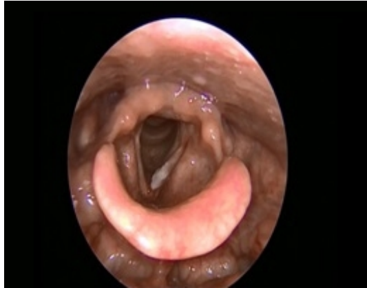
Şekil 1 : Endoskopik larenks bakıda sol vokal kordta izlenen lökoplazik lezyon

boğaz muayenesinde 70 derece rijit endoskopi ile yapılan larenks muayenesinde sol vokal kord üzerinde ön komissürü tutmayan lökoplazik kitle mevcuttu (Şekil 1).