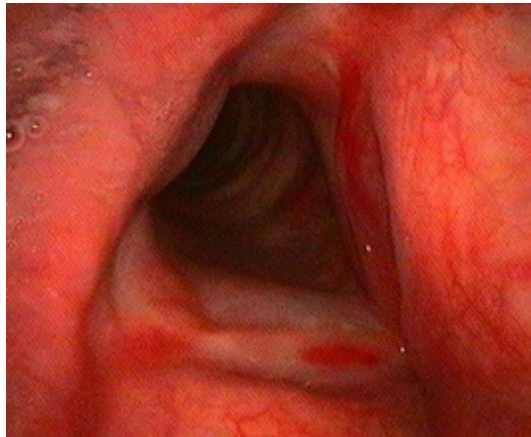
řekil 2 : Fiberoptik endoskopik larenks muayenesinde sađ vokal kord anterior 1/3'¼nde ve sol vokal kord tamamında glottik hemorajik ¼dem izlenmekte.

Palpasyon ile cilt altı amfizemi palpe edilmedi ancak tiroid kartilajı ¼zerinde hassasiyet mevcut idi. Yapılan diđer muayeneleri tabii idi. Fiberoptik endoskopik larenks muayenesinde endolarengeal mukozada laserasyon izlenmedi. Ancak sađ vokal kord anterior 1/3'¼nde ve sol vokal kord tamamında sınırlı miktarda glottik hemorajik ¼dem mevcut idi (řekil 2).