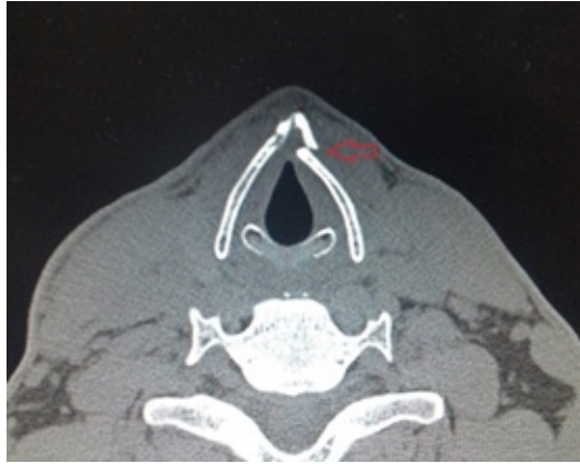
Şekil 3 : Bilgisayarlı boyun tomografi (BT) tetkikinde sol tarafta tiroid kartilaj anterior 1/3'ünde deplase fraktür hattı izlenmekte.

Hasta yatırılarak 3 gün süre ile soğuk buhar, parenteral steroid (prednol 40 mg), anti-reflü (ranitidine 25mg/ml ve aljinik asit 500mg) tedavileri uygulandı. Hastaya aynı zamanda ses istirahati ve sıvı diyet önerildi. 3. gün sonunda yakınmaları gerileyen ve endoskopik muayenede her iki glottik seviyedeki ödemi gerileyen hasta, oral anti-reflü tedavi verilerek taburcu edildi.