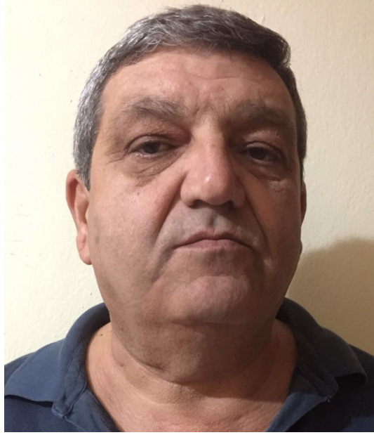
Şekil 5 : Hastanın postop 6. ay fotoğrafı