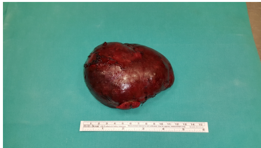
Şekil 3 : Spesimen görüntüsü

Postoperatif hastada tüm fasiyal bulgular intakttı. Dren postoperatif ikinci günde çekildi ve 3 gün boyunca baskılı pansuman yapıldı. Erken postoperatif komplikasyon gözlenmedi. Patolojik değerlendirmede lenfoid germinal merkezlerin bulunduğu stroma ile kistik boşluklar arasında papiller uzantılar görüldü ve Warthin tümörü olarak rapor edildi (Şekil 4).