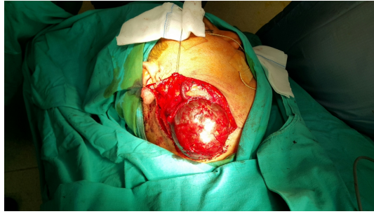
Şekil 2 : Tümörün peroperatif görüntüsü