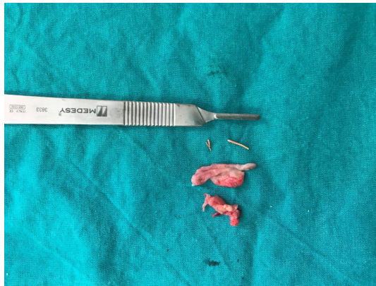
Şekil 6 : Maksiller sinüsten kürete edilen enflame dokular ve kanal dolgu materyali olan gutta perka

Hasta genel anestezi altında operasyona alındı. Sulkuler insizyonun devamında rond frez ile maksiller sinüsün lateral duvarından bir pencere açılarak sağ üst birinci molar ve ikinci molar dişlerin köklerine ulaşıldı. Maksiller sinüs içerisindeki kanal dolgu materyalleri ve etrafındaki granüle doku çıkarıldı (Şekil 6).