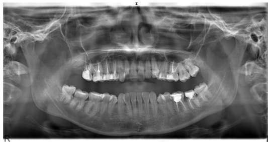
Şekil 4 : Sağ üst molar dişlerde gözlenen taşkın kanal dolumları ve sinüs içerisindeki kanal dolgu materyalleri

Yirmi bir yaşındaki kadın hasta sağ maksilla posterior bölgede ağrı şikâyetiyle kliniğe başvurdu. Üç ay önce dış merkezde hastanın sağ üst birinci molar ve ikinci molar dişlerine endodontik tedavi yapıldığı öğrenildi. Klinik muayenede sağ üst birinci molar ve ikinci molar dişlerde perküsyon hassasiyeti gözlemlendi. Ortopantomografik radyografi ve cone beam volumetrik tomografi (CBCT) yardımıyla yapılan radyografik muayenede maksiller sinüs içinde iki parça kanal dolgu materyali tespit edildi (Şekil 4) (Şekil 5).