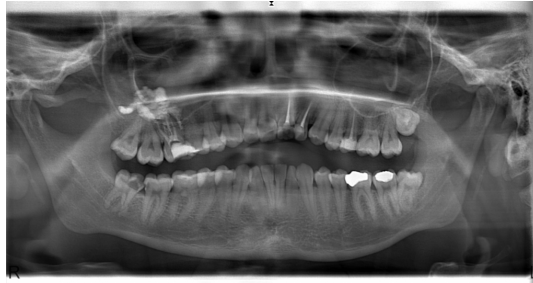
Şekil 1 : Ortopantomografik radyografide maksiller sinüste gözlenen yabancı cisim

Yirmi iki yaşındaki kadın hasta, sağ maksilla posterior bölgede ağrı ve şişlik şikâyetiyle kliniğe başvurdu. Alınan anamnezde sağ maksilla posterior bölgede, sağ üst birinci molar dişe iki hafta önce kök kanal tedavisi yapıldığı öğrenildi. Radyografik muayenede sağ üst birinci molar dişin köklerinden başlayan ve maksiller sinüs posterior duvarına kadar uzanan radyoopak bir alan görüldü (Şekil 1).