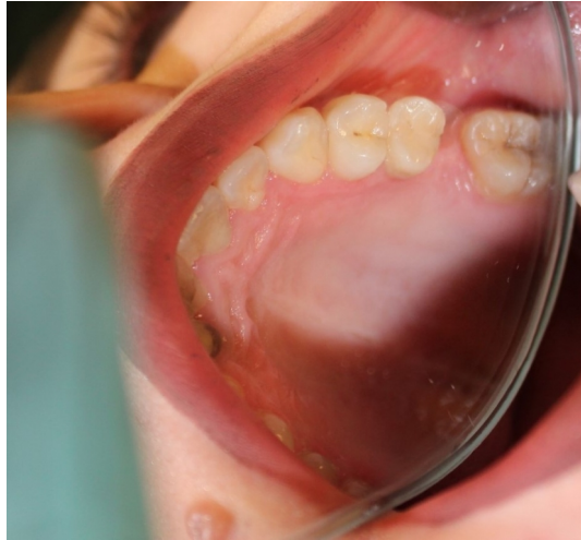
Şekil 2 : Post-operatif ikinci yıl ağız içi fotoğraf görüntüsü