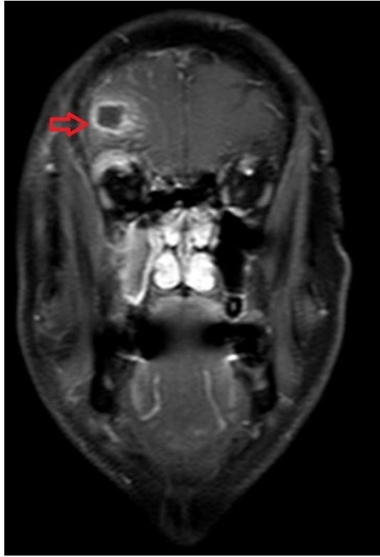
Şekil 2B : Koronal MRI kesitte sağ frontal lop apse kavitesi (kırmızı ok)

İntravenöz antibiyotik tedavisi aerop ve anaerop (seftriakson 2x1 gr IV + metranidazol 2x500 mg IV) kombine olarak düzenlendi. Tetkikleri tamamlanıp beyin cerrahi görüşü ile hasta genel anestezi altında operasyona alındı.