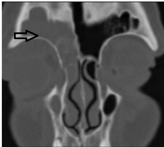
Şekil 2A : Koronal BT kesidi, sağ pansinüzit (siyah ok).

Göz muayenesinde kapak ödemi dışında görme keskinliği ve hareketleri normal, nörolojik fizik bakı olağan idi. Hastanın bilgisayarlı tomografi (BT) incelemesinde sağ taraf etmoidal, maksiller ve frontal sinüzit mevcuttu. BT de kesit alanına giren frontal lobta ensefalit süplesi görülmesi üzere MRI istendi. MRI da olgunun sağ frontal apsesi olduğu net olarak izlendi (Şekil 2).