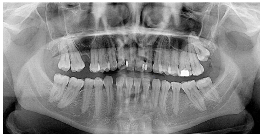
Şekil 2 : Postoperatif 3. yıl OPG

Radiküler kist ön tanısı ile hasta genel anestezi altında opere edildi. İlişkili dişin çekimi gerçekleştirildi, çekim soketi genişletildi ve kistik lezyon çekim boşluğundan enükle edildi. Histopatolojik inceleme sonucu lezyonun radiküler kist olduğu doğrulandı. Postoperatif dönemde herhangi bir komplikasyon gözlenmedi. Hastanın takipleri devam etmektedir(Şekil 2).