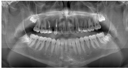
Şekil 4 : Postoperatif 3. yıl OPG

Genel anestezi altında opere edilen hastada kistik lezyonla ilişkili dişin çekimi gerçekleştirildi ve Caldwell-Luc yaklaşımıyla kiste enükleasyon uygulandı. Cerrahi saha primer kapatıldı ve operasyon sonlandırıldı. Lezyonun histopatolojik incelemesi radiküler kist ön tanısını doğruladı. Postoperatif dönemde herhangi bir komplikasyon gözlenmeyen hastanın takipleri devam etmektedir(Şekil 4).