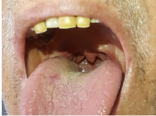
Şekil 2A : Olgunun tedavi sonrası tonsil görünümü

Biyokimya tetkikinde hafif lökositoz ve sedimantasyon yüksekliği dışında olağandı. Tetkikleri sırasında tonsil hacminin ve çevre doku ödeminin daha da artması sonucu solunum güçlüğü artan hastaya trakeotomi açıldı , bilateral tonsil biyopsileri alındı. Biyopsi sonucu Diffuz Büyük B hücreli lenfoma geldi. Hematoloji / Onkolojiye refere edilen olgunun tamamlanan tetkik ve incelemeleri sonucunda PET CT de servikal , sol akciğer, abdominal, bilateral inguinalde LAP saptandı. Kemik iliği tutulumu izlenmedi . Evrelemesi, Evre IV B olarak değerlendirilip kemoterapi protokolü hazırlandı. Olguya, 3 kür Rituximab + Bendamustein sonrası 2 kür Siklofosamid +Epinubein+ Vincristine+ Prednizolon verildi. Olgunun yakınmaları hızla azaldı, tonsil boyutları bilateral tonsil plikaları sınırlarına geriledi (Şekil 2a) ve ikinci hafta sonu dekanulman yapıldı.