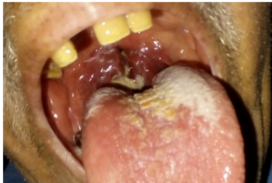
Şekil 1A : Olgunun kliniğe başvuru sırasında tonsil görünümü

Kliniğimize, 65 yaşında erkek hasta, üç hafta önce başlayan giderek artan antibiyotik tedavisine dirençli boğaz ağrısı, yutma zorluğu, alt çene köşesinde şişlik şikayeti ile gelmişti. Hastanın orofarengeal muayenesinde bilateral tonsiller ileri derece hipertrofik, yüzeyi eksudatif, kanlı ve inflame görünümde idi (Şekil 1a).