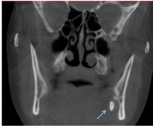
Şekil 3 : Deplase olmuş kök fragmanının preoperatif üç boyutlu bilgisayarlı tomografideki koronal kesit görüntüsü

Tomografik kesitler incelediğinde 20 yaş dişin distal kökünün submandibular bölgede kemik ile lingual yumuşak doku arasına yer değiştirdiği görüldü.(Şekil 3,4)