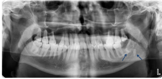
Şekil 2 : Preoperatif panoramik radyograf

Tomografik kesitler incelediğinde 20 yaş dişin distal kökünün submandibular bölgede kemik ile lingual yumuşak doku arasına yer değiştirdiği görüldü.(Şekil 3,4)