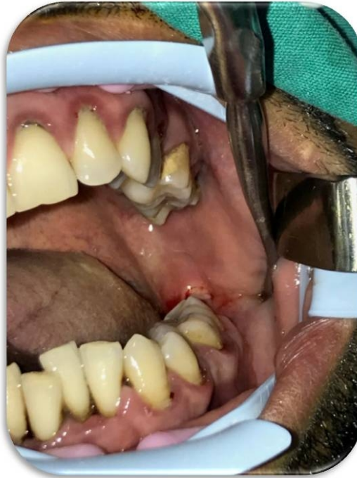
Şekil 1 : Preoperatif intraoral görünüm

Hastanın yapılan intraoral muayenesinde sol mandibular üçüncü molar diş bölgesinde iyileşmemiş çekim bölgesi, palpasyonda ağrı ve ağız açmada kısıtlılık izlendi.(Şekil 1)