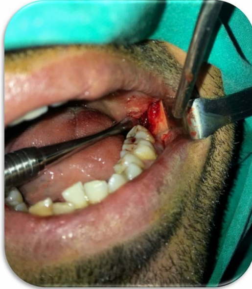
Şekil 5 : İnteroperatif intraoral görünüm

Lingual dokuda submandibular loja doğru diseksiyon yapıldı ve loja kaçmış olan kırık parçaya ulaşarak yerinden çıkarıldı. Ardından mesial kökün cerrahi çekimi yapıldı.(Şekil 6) İşlem sırasında mandibula tabanına ekstraoral bası uygulanarak kırık parçanın ağız tabanında daha derine yer değiştirmesi önlenmeye çalışıldı. Yara bölgesinin irrigasyonu yapıldıktan sonra 3/0 ipek süturlar ile primer kapatıldı. Hastaya post-operatif olarak antibiyotik, analjezik ve ağız gargarası reçete edildi. Hastada operasyon sonrası lingual sinir parestезisi görülmedi. Hastanın 1.ay kontrol muayenesinde alınan radyografide herhangi bir problem ve komplikasyon görülmedi.(Şekil 7)