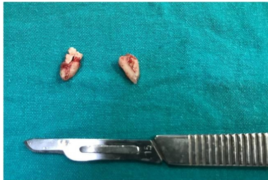
Şekil 6 : Ameliyat sonrası çıkarılan kök fragmanları

Lingual dokuda submandibular loja doğru diseksiyon yapıldı ve loja kaçmış olan kırık parçaya ulaşarak yerinden çıkarıldı. Ardından mesial kökün cerrahi çekimi yapıldı.(Şekil 6) İşlem sırasında mandibula tabanına ekstraoral bası uygulanarak kırık parçanın ağız tabanında daha derine yer değiştirmesi önlenmeye çalışıldı. Yara bölgesinin irrigasyonu yapıldıktan sonra 3/0 ipek süturlar ile primer kapatıldı. Hastaya post-operatif olarak antibiyotik, analjezik ve ağız gargarası reçete edildi. Hastada operasyon sonrası lingual sinir parestезisi görülmedi. Hastanın 1.ay kontrol muayenesinde alınan radyografide herhangi bir problem ve komplikasyon görülmedi.(Şekil 7)