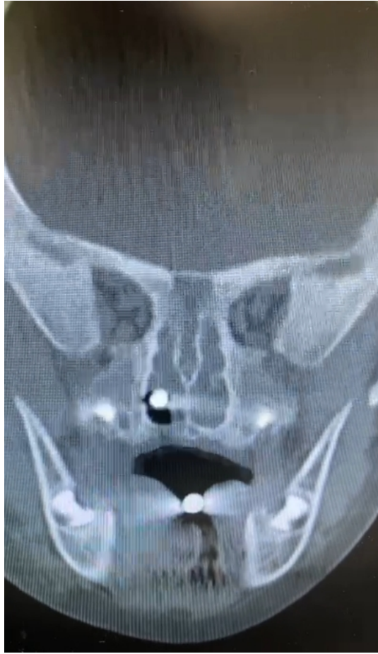
Şekil 4 : Yabancı cismin koronal plan BT görüntüsü

Maksillofasial BT görüntülerinde cismin orofarenksten nazofarenkse ve sağ koanaya uzandığı ayrıca orofarenks ve nazofarenks posterior duvarında vasküler ve nörolojik bir yaralanma olmadığı izlendi. Hastanın ebeveynlerinden aydınlatılmış onam alınarak ameliyathane şartlarında, genel anestezi altında yabancı cismin çıkarılmasına karar verildi.