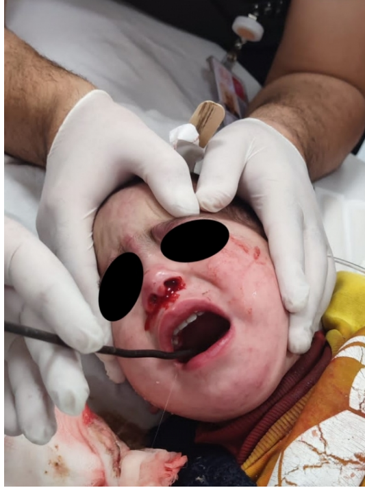
Şekil 1 : 3 yaşında erkek hastada ağız içinden koanaya uzanan rijit metal yabancı cisim

Oral kaviteden içeriye uzanım gösteren oval, metal bir çubuk şeklinde yabancı cisim nedeniyle 3 yaşında erkek hasta ailesi tarafından acil servise getirildi.