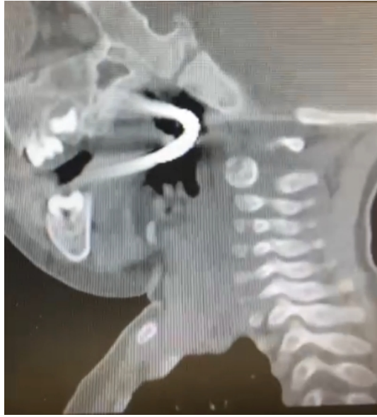
Şekil 3 : Yabancı cismin sagittal plan BT görüntüsü

Aileden alınan anamnezde yabancı cismin soba kovası tutmak için kullanılan bir alet olduğu ve kazanın evde kardeşleri ile oynadığı sırada düşme sonucu gerçekleştiği öğrenildi. Aile travma sonrası burundan kanama olduğunu, herhangi bir nörolojik semptom olmadığını belirtti. Hastanın acil serviste ilk değerlendirmesinde bilincinin açık, koopere, oryante fakat ajite olduğu izlendi. Nazal kavitede kan pıhtıları izlenirken, aktif kanama izlenmedi. Hastanın orofarenks muayenesinde dil, bilateral tonsil lojları, yumuşak ve sert damakta laserasyon, aktif kanama odağı izlenmedi. Hastaya gerekli tetanoz ve antibiyotik profilaksisi yapılarak yabancı cisim hareket etmeyecek şekilde ileri değerlendirme için Maksillofasial BT çekildi.