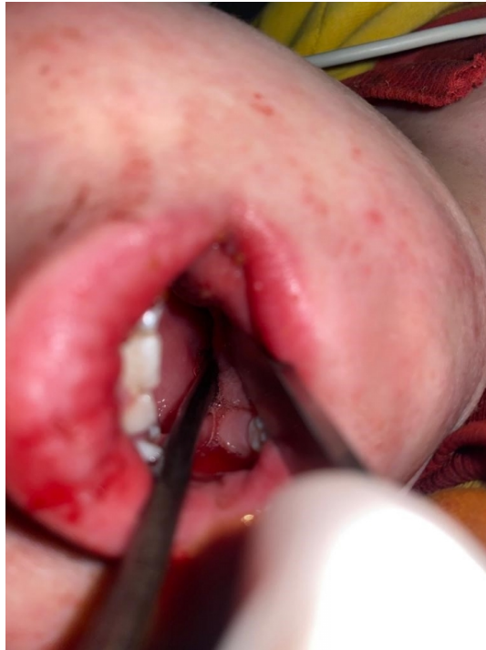
Şekil 2 : Yabancı cismin ağız içinden görüntüsü