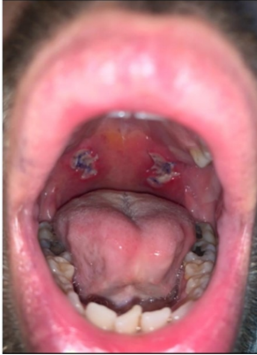
Şekil 4 : Post-op 2. gün