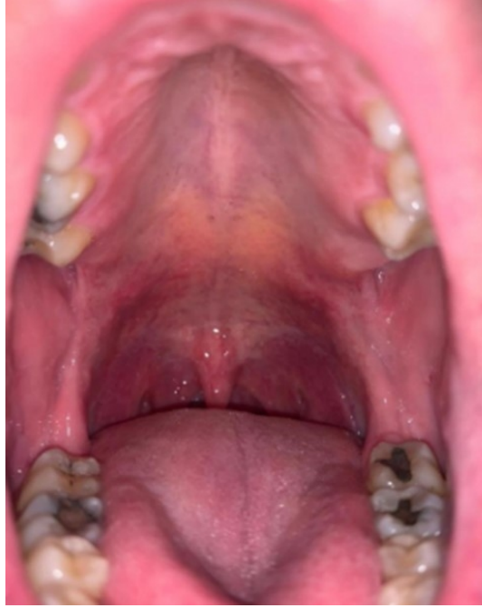
Şekil 1 : Preoperatif intraoral görünüm

Doğrulama amaçlı hastaya bilgisayarlı tomografi çekildi. Sağ pterigoid hamulus 24.59 mm, sol 25.20 mm olarak ölçüldü (Şekil2).